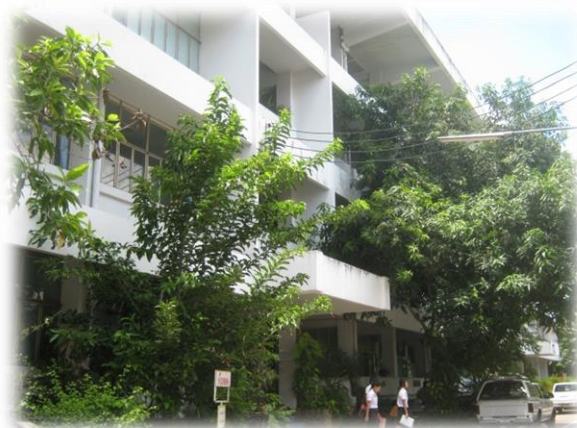
อาคาร 4 อาคารอัมพวัน