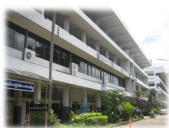
อาคาร 3 อาคารลีลาวดี

ชั้นที่ 4 ใช้เป็นห้องเรียนทฤษฎีสังคมศึกษา วิทยาศาสตร์ ภาษาไทย คณิตศาสตร์ และ ห้องพักรู